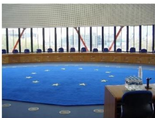
Evropský soud pro lidská práva

Gruzie podala k Evropskému soudu pro lidská práva dvě žaloby proti Ruské federaci. První z nich - tzv. mezistátní stížnost - podalo gruzínské ministerstvo spravedlnosti, druhou – individuální stížnost – podali rodiče Arčila Tatunašviliho, Gruzína zahynulého za podezřelých okolností v Jižní Osetii (více k případu viz březnový a červnový zpravodaj). Dle gruzínského ministerstva mezistátní žaloba míří na „praxi masového narušování práv, zadržování, útoku a zabíjení gruzínských občanů na Ruskem okupovaných teritoriích a podél okupační linie“. Tato zvůle z pohledu Gruzie zesílila po válce z roku 2008 a vyvrcholila letos v únoru právě případem Arčila Tatunašviliho. Gruzie usiluje o uznání Ruska zodpovědným z porušení řady článků Evropské úmluvy o lidských právech, včetně práva na život, zákazu mučení či práva na svobodný pohyb. Jedná se již o třetí mezistátní žalobu vznesenou Gruzii vůči Rusku - první z nich, týkající se deportací gruzínských občanů z Ruské federace, skončila pro žalující stranu úspěchem. Rusko nicméně již v roce 2015 přijalo zákon, umožňující mu „přehlasovat“ rozsudky Štrasburkského soudu v případě, že „odporují jeho ústavě“.