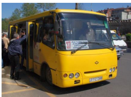
Autobus 37.

Tbiliská dopravní společnost oznámila, že autobus městské veřejné dopravy č. 37 bude nově obsluhovat tbiliské letiště i během noci, kdy přistává a odlétá většina letadel. Cena jízdného bude stejná jako ve dne, tj. 50 tetri (asi 5,50 Kč), a autobusy pojedou v intervalu 30-35 minut. I trasa autobusu bude stejná jako ve dne, tj. z letiště pojedou přes Avlabari, náměstí Svobody a náměstí Hrdinů až na hlavní vlakové nádraží. Jedná se tak o historicky první noční spojení letiště s centrem města veřejnou dopravou, nepočítáme-li vlak, který ovšem jezdí na letiště pouze dvakrát denně a je v podstatě zcela nevyužívaný.