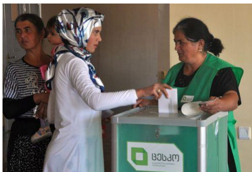
Volby v Gruzii.