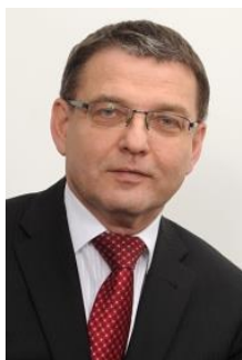
Lubomír Zaorálek