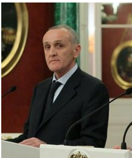
Alexandr Ankvab

Do čela opozice se postavil Raul Chadžimba, bývalý důstojník KGB, předseda vlády z let 2003-2004. Situace znovu eskalovala na samém konci měsíce. Dne 27. května se několik tisíc lidí shromáždilo v centru Suchumi a požadovalo demisi vlády. Poté, co dav zaútočil na prezidentovu residenci, ten pod tlakem vládu rozpustil a odvolal i kritizovaného generálního prokurátora. Poté se uchýlil na ruskou vojenskou základnu u města Gudauta. Část demonstrantů posléze dokonce prezidentovo sídlo obsadila. Přesto, že se prezident Alexandr Ankvab nevzdal svého úřadu, opozice sestavila přechodnou vládu v čele s Valerijem Bganbou, dočasně pověřeným prezidentskými pravomocemi, kterou zákonodárci schválili poměrem 24 hlasů z přítomných 25. Parlament zároveň vyjádřil nedůvěru svému dosavadnímu předsedovi a spojenci