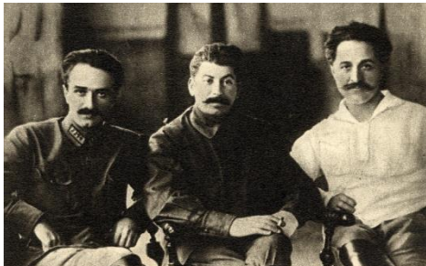
Zleva: Mikojan, Stalin, Ordžonikidze.