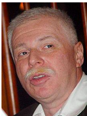
Mediální magnát Badri Patarkatsishvili, mj. majitel Imedi TV.

Gruzínská pobočka Transparency International vydala poměrně detailní zprávu o vlastnických vztazích ve více než dvaceti největších médiích v zemi. Zpráva mimo jiné konstatuje, že majitelé některých významných médií mají nebo v nedávné minulosti měli úzké vztahy na obě soupeřící politické koalice - Sjednocené národní hnutí a Gruzínský sen. Potěšující zprávou je, že tyto vlastnické vztahy se od roku 2011 stále více zprůhledňují a dnes si již jen jedna z mediálních korporací ponechává neprůhledné vlastnické vztahy. Gruzínská mediální realita je nicméně značně poznamenána koncentrací vlastnictví v rukou několika mocných jednotlivců a rodin. Nejznámější je v tomto ohledu asi rodina Patarkatsishvili, vlastníci kromě televize Imedi také mobilního operátora Magticom, minerální vodu Boržomi nebo oblíbený zábavní park na kopci Mtatsminda v Tbilisi.