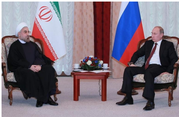
Rúhání na setkání s Putinem.

(EN) http://www.rferl.org/content/azerbaijani-human-rights-activist-released-after-questioning/25367634.html