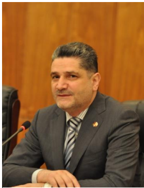
Tigran Sarkisjan.

(EN) http://www.rferl.org/content/armenia-to-sign-agreement-on-joining-customs-union-in-may-june/25354950.html