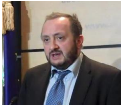
Giorgi Margvelašvili.

Sídlo gruzínského prezidenta se po nástupu Giorgi Margvelašviliho do funkce změnilo.