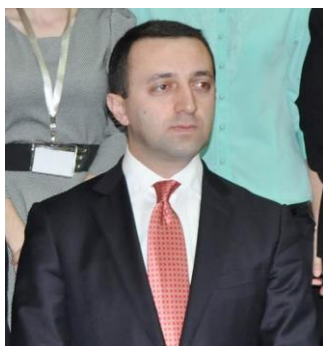
Irakli Garibašvili.

(EN) http://www.rferl.org/content/feature/25184812.html