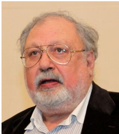
Rustam Ibragimbekov.

(EN) http://www.aysor.am/en/news/2013/07/23/ahdam-artsakh/