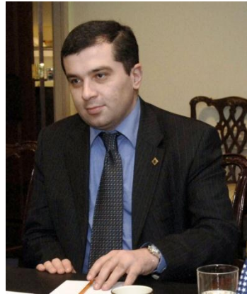
Davit Bakradze.

Gruzínská vláda oficiálně vyzvala relevantní mezinárodní organizace, aby do země vyslaly své monitorovací mise pro nadcházející prezidentské volby. Výzva byla směřována Organizaci pro bezpečnost a spolupráci v Evropě (OBSE), Radě Evropy, organizaci GUAM sdružující Gruzii, Ukrajinu, Ázerbájdžán a Moldavsko, a NATO. OBSE již svou účast potvrdila a v následujících týdnech pošle do Gruzie předběžnou hodnotící misi. Samotná pozorovatelská mise začne 6-8 týdnů před volbami. Termín voleb byl nakonec definitivně stanoven na 27. října.