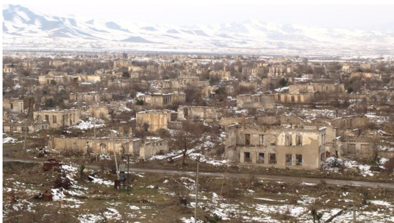
Trosky města Agdam. Foto: Štěpán Lohr (2012)

23. července uběhlo již 20 let od zničení karabašského města Agdam. Z kdysi čtyřicetitisícového města se stalo neobydlené město duchů, které se dnes nachází v nárazníkovém pásmu mezi vojenskými pozicemi Arménie a Ázerbájdžánu. Zástupci ázerbájdžánské diaspory v USA při této příležitosti obnovili již tradiční kampaň