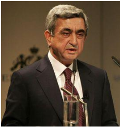
Serž Sargsjan

Prosperující Arménie navíc oficiálně oznámila, že do nadcházejících voleb nebude nominovat žádného kandidáta. Stejně tak lídr nejsilnější koalice opozičních stran, Arménského národního kongresu, a první arménský prezident Levon Ter-Petrosjan nebude ve volbách kandidovat. Kromě Sargsjana tak zřejmě ve volbách nebude žádný jiný perspektivní kandidát.